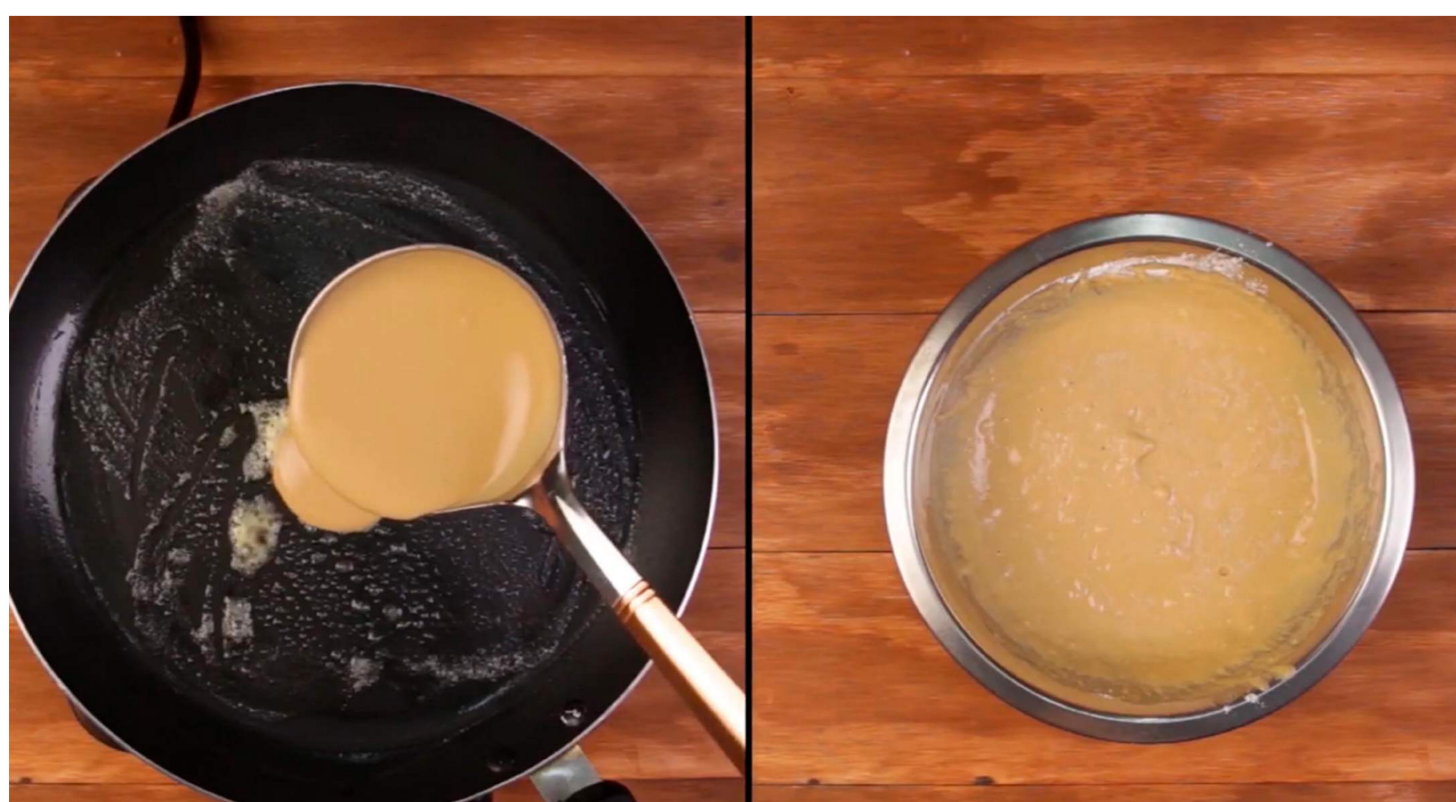
5. Vierte una cucharada de la mezcla en la sartén.