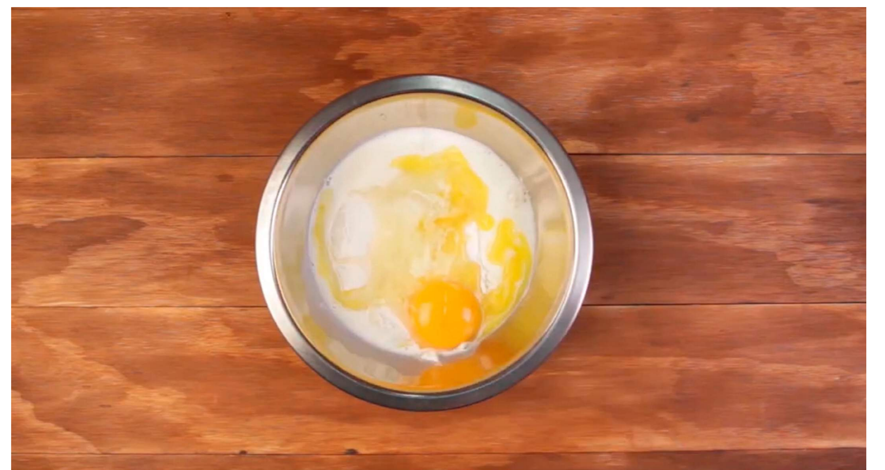
2. Incorpora en un recipiente 1 sobre de mezcla lista para pancake CORONA, 1/2 taza de leche, 1 cucharada de mantequilla derretida, 1 huevo y por último 1 pocillo de Café Sello Rojo Tradicional.