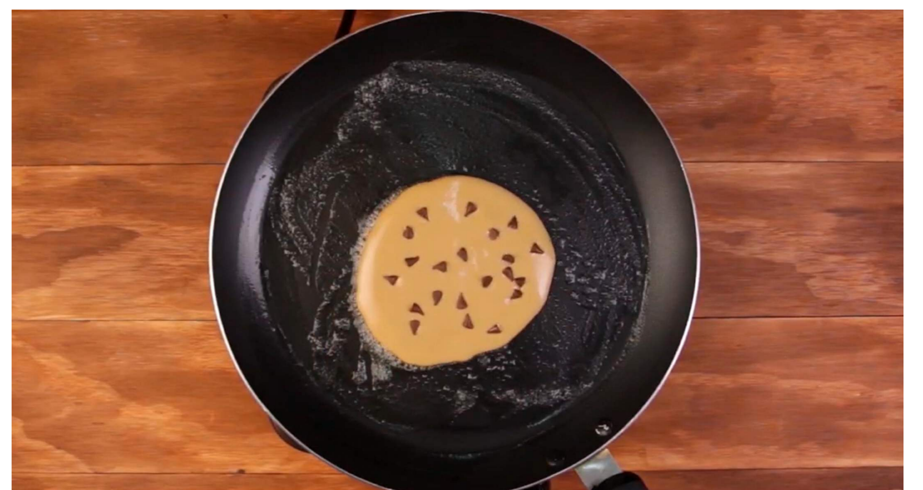
6. Añade chips de chocolate.