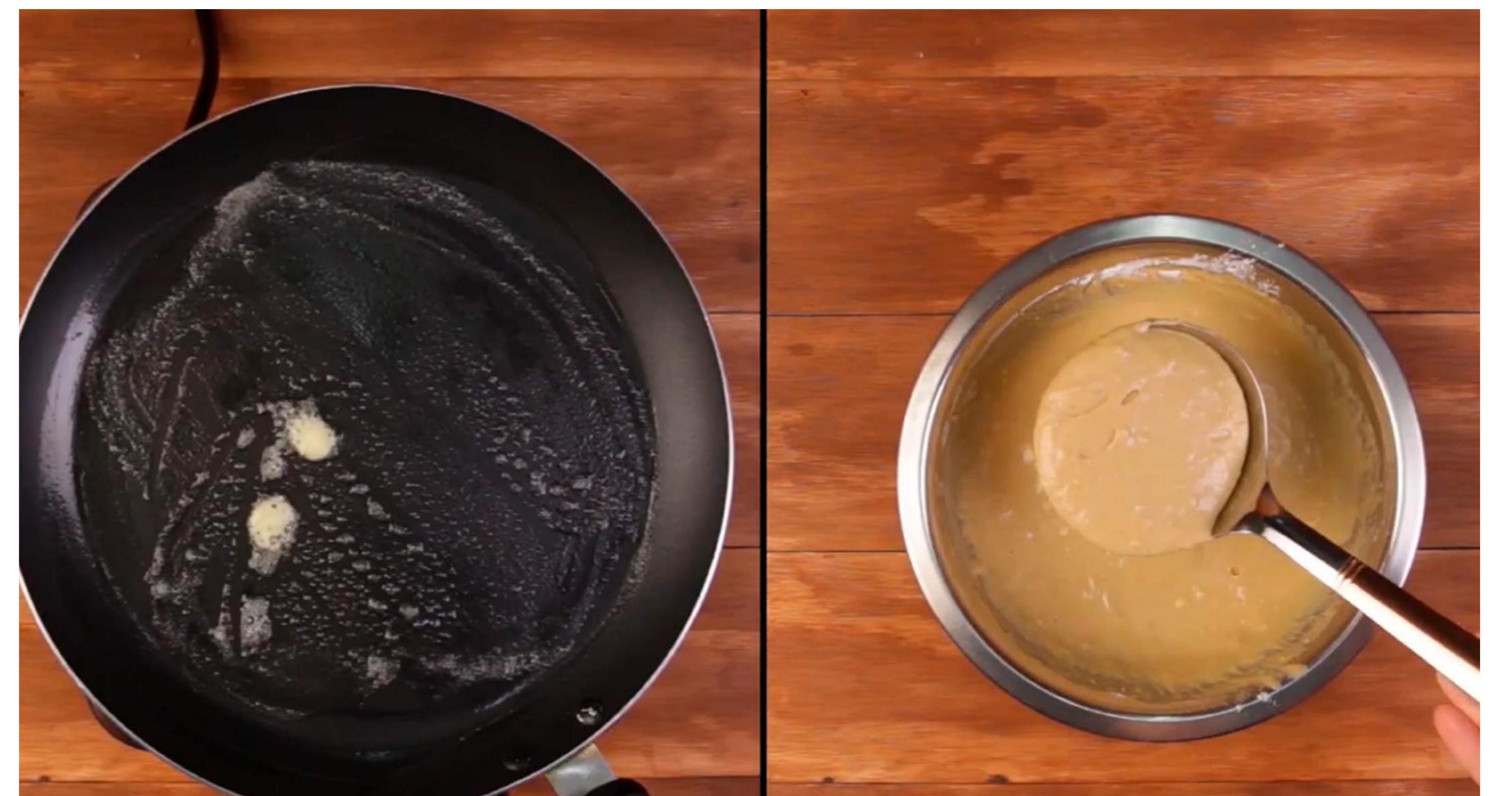
4. Agrega mantequilla a un sartén caliente.