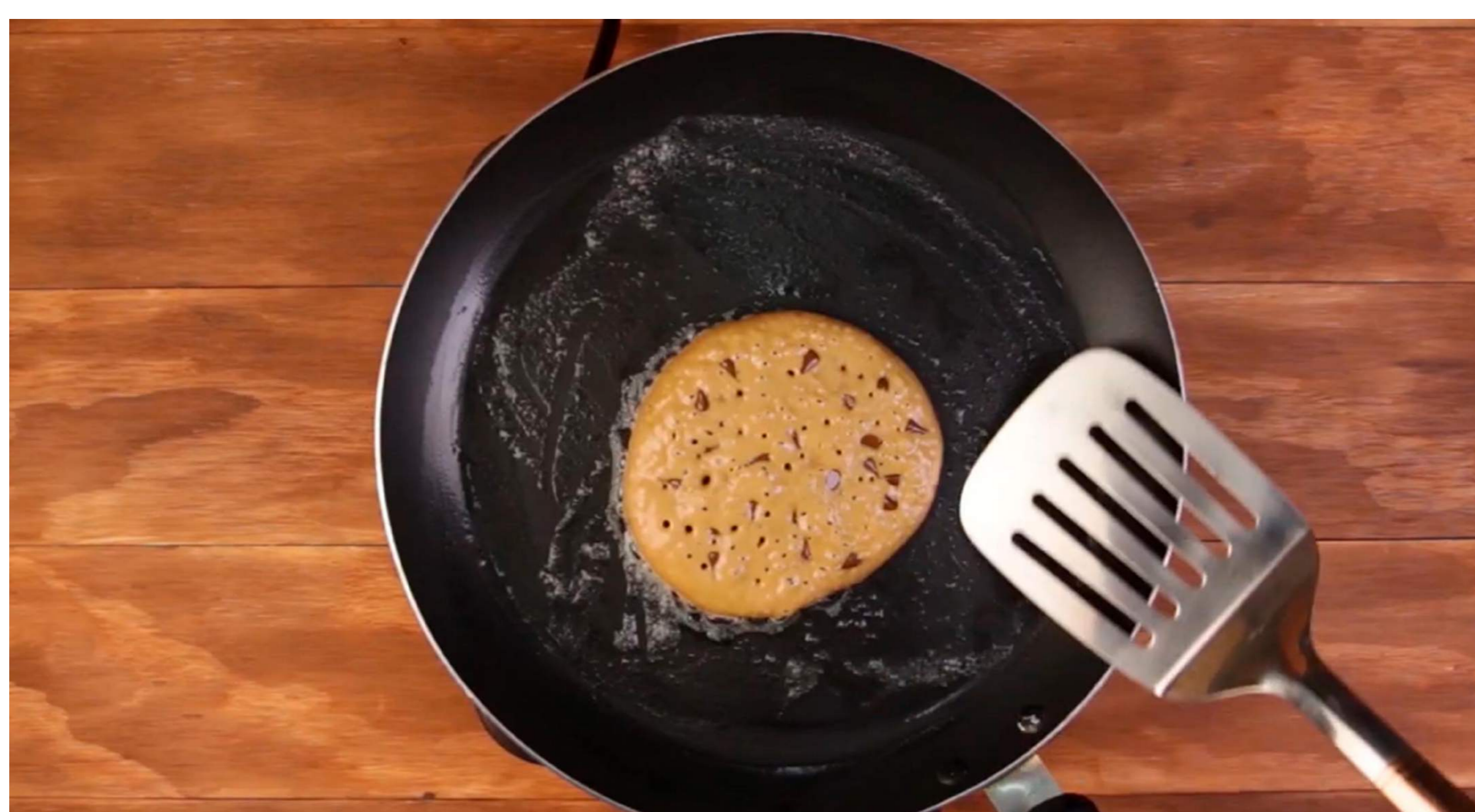
7. Cuando la superficie del pancake comience a llenarse de burbujas voltéalo y déjalo por 1 minuto más