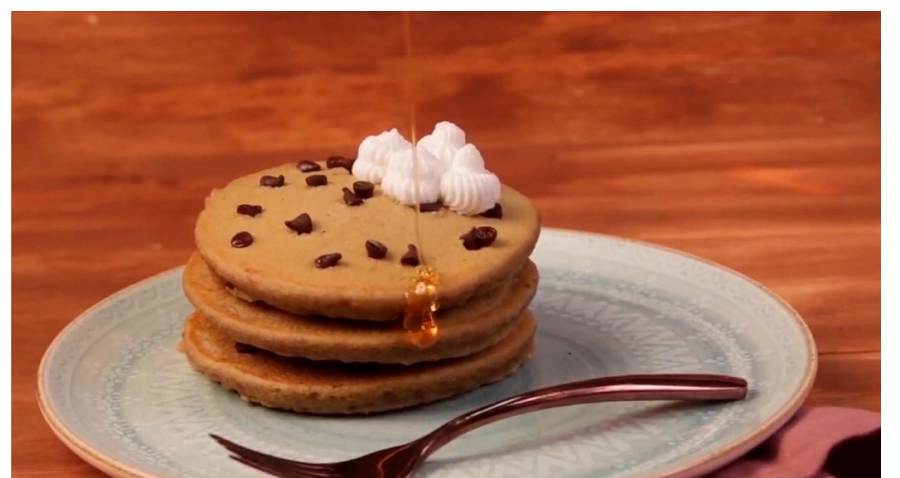
8. Agrega miel o syrup y directo a la mesa.