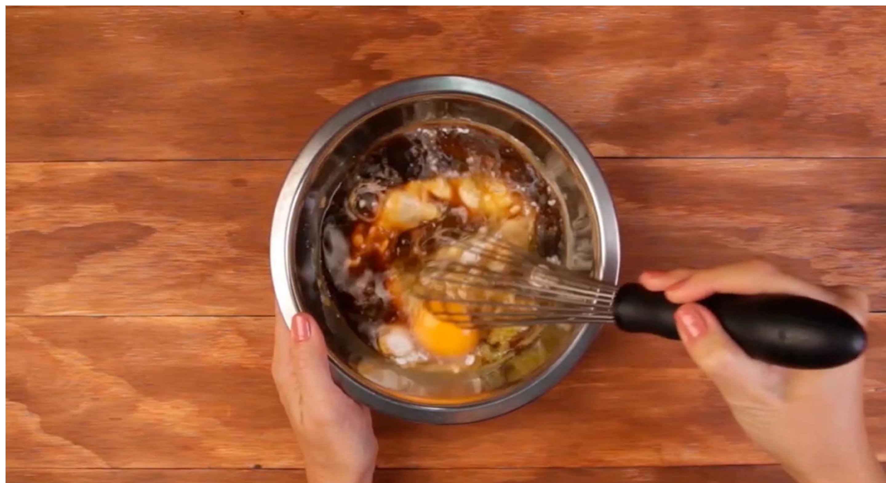
3. Mezcla hasta que todos los ingredientes tengan una consistencia homogénea.